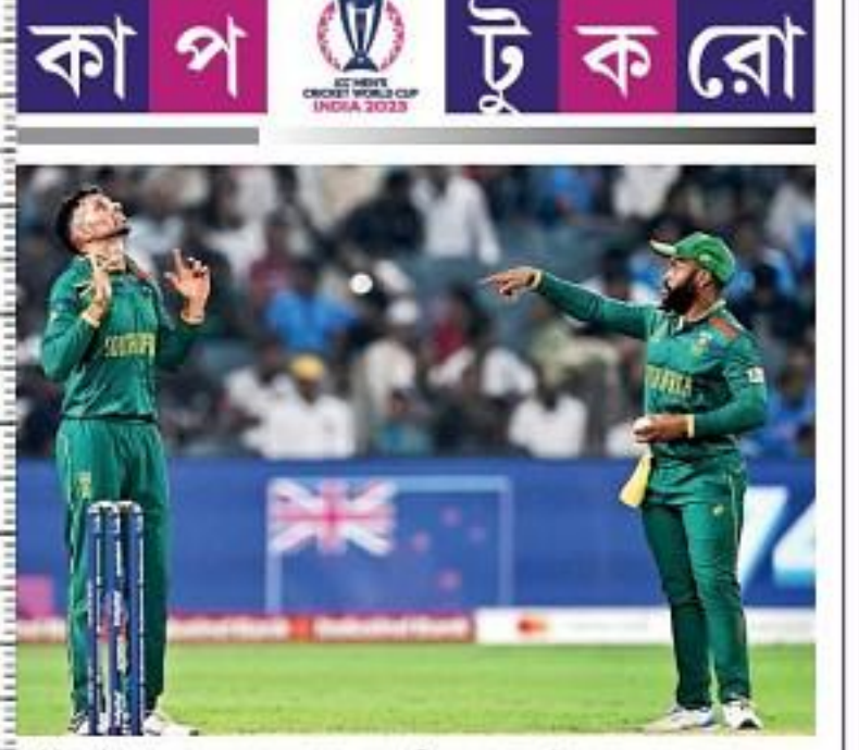
🗢 🔚 উইকেট পাওয়া কেশৰ মহারাজকে অভিনন্দন ক্যাপ্টেন বাভুমার। বুষবার